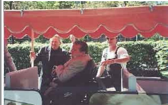
Und los geht's ...