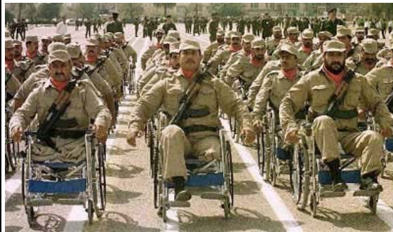
Das 4. Rollstuhl-Bataillon ist angetreten...